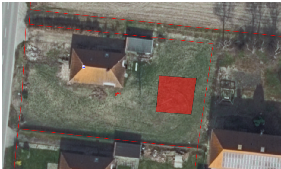
Figur 1: Luftfoto af ejendommen. Den røde markering viser udhusets omtrentlige placering.

Lolland Kommune giver hermed tilladelse til et udhus på 99 m 2 i henhold til § 35, stk.1 i planloven.