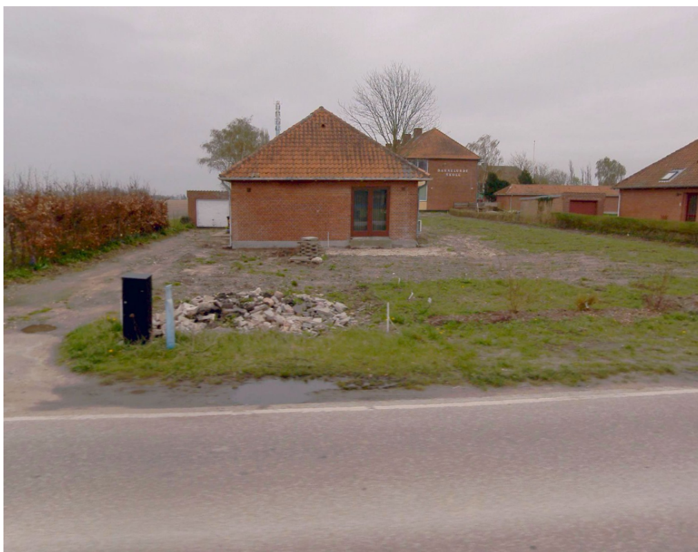
Figur 3 Gadefoto af ejendommen, som udhuset etableres på. Udhuset etableres bagved boligen, set fra Græshavevej.

I afgørelsen har kommunen yderligere lagt vægt på, at der i forvejen på ejendommen kun er et mindre omfang af sekundært byggeri, bestående af en mindre garage på 24 m 2 .